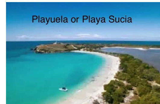
Playuela or Playa Sucia